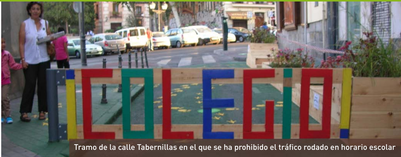
Tramo de la calle Tabernillas en el que se ha prohibido el tráfico rodado en horario escolar